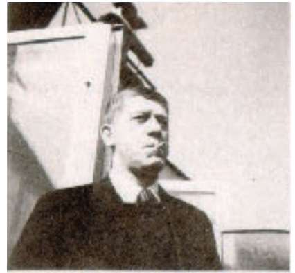
אוסקר קוקושקה, המאהב העוצמתי

על הטילול בהצגה הזאת אני יכולה לדרוש רק באופן לא מסודר. היו פעמים שבתוך ההמוניות ללכת אחרי אתה האלי מות, אבל תעיתי ביער האורחים המתרוצצים, בתוכם גם נכים על קניים שרדו בעון, כמו צליינים בדרכס אל האור. את שלוש האלמות מיינתי לעצמי כך: הצעירה הסקסית סית עם האף המחוורד והשיער השחור, הצעירה הבלבדנית (שמדברת אגב אנגלית ולא גרמנית) שהיא שחקנית בעלת