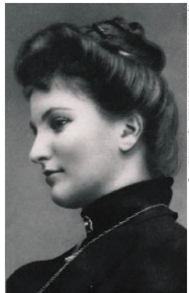
אלמה שינדלר נווקה מהפנט, 1900-1901