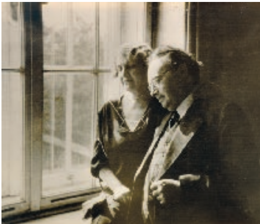
אלמה עם פרנץ ורפל, בעלה השלישי

לילות או ימי אהבה, ופרידה, שלח גרופיוס לאלמה מכתב אהבה שמפציר בה לעזוב את חייה הקודמים. אבל במקום להיפנות אותו אליה כתב על המעטפה: "לכבוד גוסטב מאהלר". מאהלר המבועת מהגילוי (עומק הראייה של אמנים עשוי להיפוך לעיוורון כשמדובר בקרובים להם), הלך לפגוש את זיי גמונד פרויד. זה היה מפגש אנליזה מזורז, בן ארבע שעות, שתועד באופן חלקי ואיפשר למחברי ספרים על מאהלר או אשתו לדמיין אותו, וגם סובל עושה את זה בסצנה משעשעת שבה משתמשים קצת בידיש ומאהלר אומר "שמוק", במקום "שוק", ומכאן מתבררים העניינים מיד. מפרויד חזר מאהלר עם הבנה מסיימת, שאמלל את אשתו כי היה מסוגל לאהוב רק אישה הרומה לאמו המיוסרת והחרדנית. תוכנה מאוחרת מדי, גם בגלל שבריאיותו הידרדרה. בכוחותיו האחרונים אסף מאהלר את אשתו בהצהרות אהבה ומחוות מתוקות (למשל, תעורת זיכוי לרכישת הילום מונחת על מצע ורדים). הוא השאיר לה פתקים על שולחן הלילה שלה: "נשמת אפי, אלף נשיקות הרעפתי על נעלי הבית הקטנות שלך, ועמרת מלא תשוקה בוערת ליד הפלת שלך". המעבר החריף משליטה בה לכניעות ולתלות הגביר את געגועיה לגרופיוס.