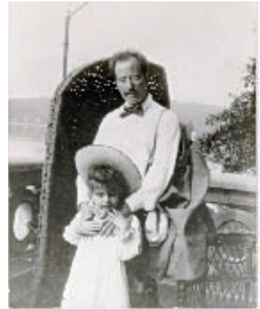
גוסטב מאהלר, בעלה הראשון של אלמה, עם בתם מריה

פזה ההדגמה, אין ספק, היתה טוטאלית. ומי יודע, איש לא התנצל בפני מעולם, אולי פשוט דהרהר רכבת האקסטוזה שלהם ולא הצליחה לעצור כומו? לי זה לא היה משנה. לא נהגתי בכלל. המכות הכאיבו לי. היה לי מחסור באוויר. הרוקות נמשכו כנצה, ייבבתי קלות, הכובע שלי, ברט קטיפה שחור, רטט מתחת לעיני גבות הבובה. מהצד יכולתי להבחין רק בגוסטב קלימט, שאותו מגלם שחקן שכבר בסצנות קודמות הבהיל אותי בטרנס שלו, עם תנועות גוף מעוקלות כמו בצירויים של קלימט, משליך את אגן ירכיבו בתלהבת אל הבובה, שהיתה כבר אני. ועם זאת, ממעמקי מצבי הפוסט טראומטי ומתוך גרלות נפש מסוימת, אני חוזרת וטוענת ש"אלמה", הצגה שהפכה לפולחן בינלאומי, וינה, ברלין, ליסבון, ונציה, לוס אנג'לס, ועושה את דרכה לישראל, היא תופעה מרעושה במעברים בין עוצמה אנטישית לחולשה, כמשהק נפלא בתקריב קולנועי, במורבריות שחורה, בשמחת החיים, בהרפתקאות, בסיו, כון, בהגזכות מיתוס פאטאל, ובצעם כל מיתוס.