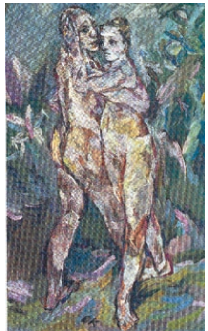
אוסקר קוקושקה, "הנאבהים", 1913. החזן בין אלמה לקוקושקה עולה על הבד

אנשים באים לראות את ההצגה שוב ושוב, מתייצבים ברלפק המלון עם תיק קטן ללינת לילה, מודיעים בצ' ליל ארוטי גאה לפקידת הקבלה: "אנחנו באנו ל'אלמה!". פסיכיאטר וינאי אחד היה באירוע שמונה פעמים, ויש צופה מיתולוגי אחד שצבר 73 ביקורים בהצגה