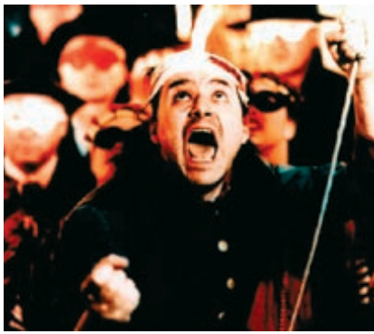
הבמאי פאולוס מנקר. חוגג בתפקיד קוקושיקה